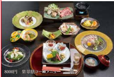
8000円 紫翠膳コースメニュー一例