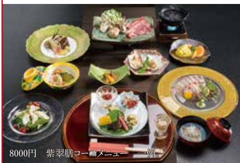
8000円 紫翠膳コースメニュー一例