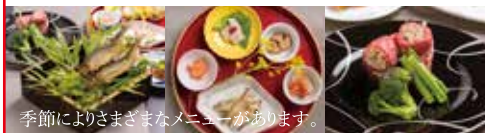
季節によりさまざまなメニューがあります。