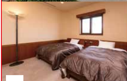
1階2階が階段で繋がるメゾネットタイプ

こんな近くで 遠くの気分 大人の夏休み 移動時間を節約 贅をつくした宿で過ごす ※写真は展望風呂